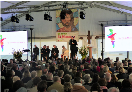
Neuvizy - 8 septembre 2019 Lancement du projet diocésain !

Je crois que le dispositif pastoral que nous avons adopté, avec des prêtres envoyés dans un espace missionnaire, des paroisses confiées aux laïcs, un conseil d'animation missionnaire, tout ceci décale nos relations de pouvoir et de collaboration et devrait nous aider à trouver des relations plus justes, plus dignes du Christ Jésus et de son offrande.